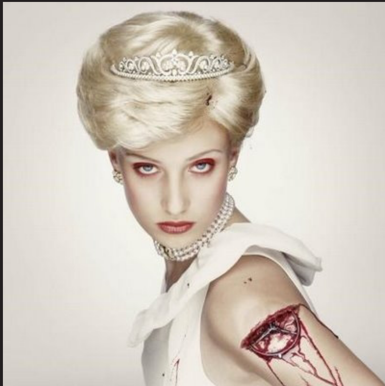
Royal Blood 2000