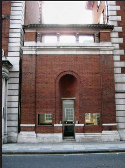
Hamiltons Gallery London